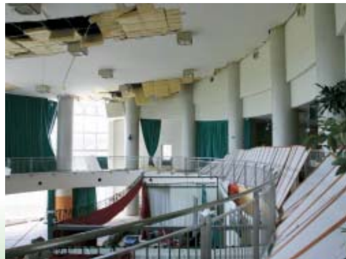
▲ 激震により破壊されたハイルザーム栗駒室内

平成20年6月14日(土) 午前8時43分に発生した、岩手県南部を震源とする「岩手・宮城内陸地震」から、約半月が過ぎました。 この地震災害で尊い命を奪われた方々に対し、深く哀悼の誠を捧げます。 また、いまだ行方不明の皆さまの一刻も早い救出を願うものであり、けがをされた方、大切な家屋や財産を失われた方々に心よりお見舞いを申し上げます。 栗原市を突然襲ったこの地震は震度6強を観測。私たちに不安と多大