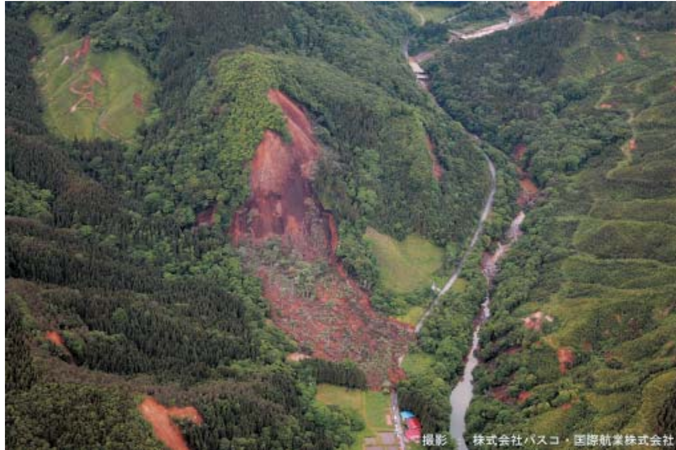
▲ 三迫川右岸側の山腹崩壊