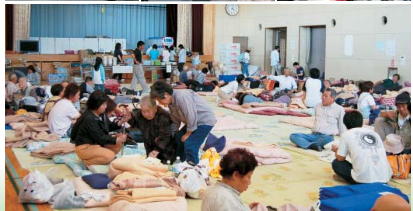
▲花山地区避難所の様子