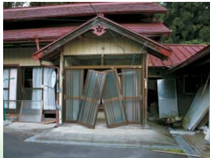
▲ 被災した栗駒沼倉地区の住家