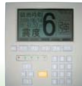
▲ 震度6強を表示した地震記録計

組んでまいりました。 さらに全国から支援物資や大勢のボランティアの方々が、地震直後から駆けつけてくださり、被災者支援や復旧活動支援をいただいたことに対しまして、深く感謝と御礼を申し上げます。 現在、市では関係機関と協力して避難所で困難な生活をしている皆さんへの物資の供給、医療の提供など被災者への支援活動を行うと共に、早急にライフラインなどの復旧活動や生活基盤回復のため総力をあげて取り組んでまいります。そのためには、市、市議会、市民の皆さんが手を携え一丸となって、栗原市の結束力の強さを発揮し、立ち向かわなければなりません。 今が一番厳しく、苦しい時ではありますが、一日でも早く市民の安心・安全な生活の安定に向け、頑張っ