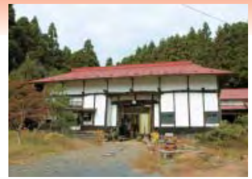
▲市内に数多くある長屋門