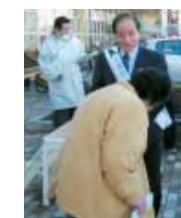
▲ヨークベニマル若柳店でキャンペーンを行う佐藤市長

キャンペーンでは、佐藤市長をはじめ、自殺防止対策連絡協議会の委員、ボランティアの方々などが買い物客にちらしなどを配布し、自殺防止を訴えました。