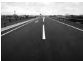
▲12月24日(月)、国道4号築館バイパス一部開通

20日(金) 手で2007世界ユースホッケー1世界大会に出場(14日土)「オーストラリア・シドニー」 新潟県中越沖地震被災地へ災害物資支援 ※柏崎市、出雲崎町