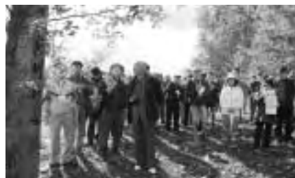
▲2日目の街道探訪会。歴史を調べるだけでなく、風景や交流、地域の文化や料理を楽しむのも街道探訪の魅力です