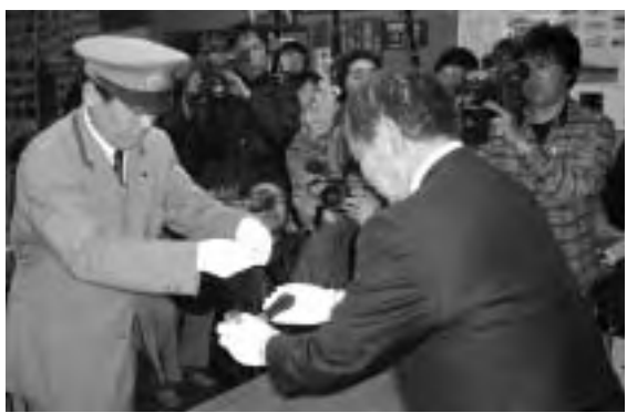
▲3月31日(土)、すべての列車運行が終わった午後10時半過ぎ、くりはら田園鉄道本社に全社員が集まり、運転車両課長が社長に列車運転ハンドルを返還し、約90年にわたるくりでんの歴史に、終止符が打たれました