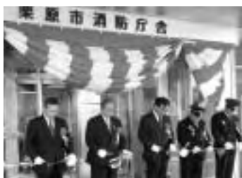
▲5月26日(土)、安全・安心の拠点としての消防庁舎が開庁