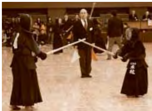
▲5年男子個人の試合の様子

選手が掛け声とともに、技を決めると会場に応援に駆けつけた父母の皆さんからは、「もう一本!」「よっしゃ!」と歓声があがっていました。