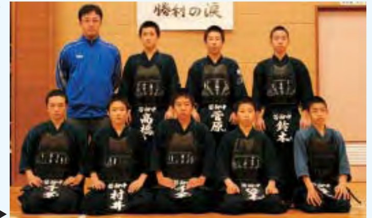
若柳中学校剣道部の皆さん▶

若柳中学校は、平成19年11月3日(土)に大崎市の古川総合体育館で行われた県大会で優勝。全国大会への切符を手に入れました。