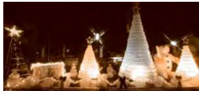
▲築館の夜を照らしたペットボトル4,000本使用のクリスマスツリー

会場では、地場産品を利用した料理の試食・販売、伝統芸能などのステージ発表、ペットボトルツリーの点灯式などが行われ、多くの人でにぎわいました。