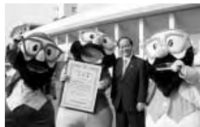
8月4日(土)、楽天マスコットを栗原初の親善大使に任命