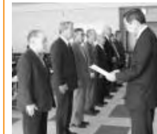
▲柳川副市長から認定証を手渡される自主防災組織代表の方々