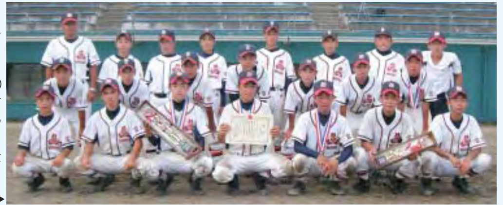
若柳中学校野球部の皆さん▶

若柳中学校野球部は、平成19年8月18日(土)・19日(日)に岩沼市の海浜緑地球場で行われた県大会で優勝。3年ぶりの全国制覇と世界大会を目指します。