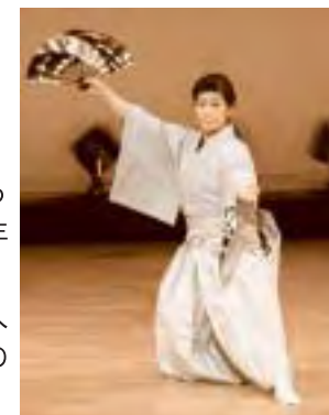
▲千晶流菊乃会の舞踊「米百俵」