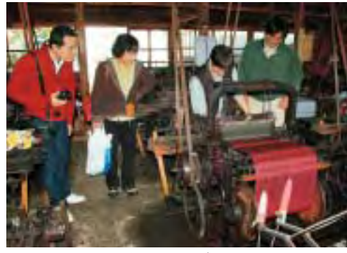
▲地域の歴史を感じるものづくりの現場

点と点のシステムを線になるようにストーリーを作り、それをプログラム化して観光商品や体験商品などとしてつくり上げていき、外とつないでいく。お客様を呼んできた、お客様の申し込みに対し