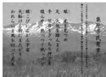
▲9月1日(土)、栗原市民憲章を制定しました

2007年、市民の皆さんはどんな一年でしたか？ 3月には、くりはら田園鉄道が約90年の歴史に幕を下ろしました。5月には、栗原市消防庁舎が完成し、これまで以上に安全・安心に暮らせるようになりました。また、9月には、市民憲章が制定され、市民の生活していく上での指標ができました。12月には、国道4号バイパスが一部開通し、交通の利便性が向上しました。市の話題を、1月から振り返ってみます。