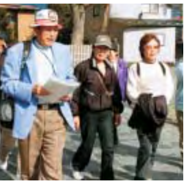
▲観光ガイドなど、受け入れる体制づくりが必要

しかし、まだこれからですね。国の子ども農山村交流プロジェクトや観光事業では経済産業省、国土交通省からいろいろな事業が出てきました。これらをよく見て、しっかりとやってほしい。