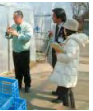
▲交流で農業の素晴らしさを再発見

市長 新年にあたって今年の素晴らしい目標ができました。「仙台・宮城・デスティネーションキャンペーン」は一つの里塚という形でとらえ、我々もつと先を見据えてしっかりと歩み続けていきたいと思えます。どうもありがとうございます。