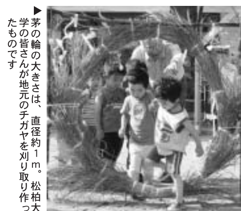
▶茅の輪の大きさは、直径約1m。松柏大学の皆さんが地元の子ガヤを刈り取り取り作ったものです

瀬峰保育所は、幼児たちと地元の高齢者サークル松柏大学との交流会を行いました。茅の輪は、チガヤというイネ科の植物で作る輪のことです。くぐると、健康に暮らすことができると言われています。子どもたちは、松柏大学の皆さんに、茅の輪をくぐる正しい方法を教えてもらい、友達と一緒に楽しみながら輪をくぐっていました。