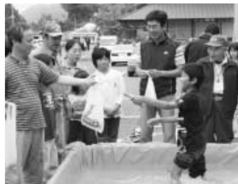
▲びしょ濡れになりながらもイワナを捕獲。晩のおかずは、イワナの塩焼き？

渓流釣りやダム役割について楽しみながら理解を深めてもらうイベントが開催されました。14日(土)に行われた川魚のつかみ取りコーナーでは、子どもたちがイワナやヤマメと格闘。素早い動きの魚をやつとの思いで捕まえると、周りの大人たちから歓声が上がりました。ほかに、釣り人たちが製作した竹ざおやりールなどの展示もあり、愛好者たちの興味を引いていました。