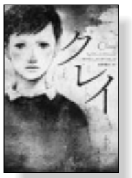
『クレイ』 デイヴィッド・アーモンド著