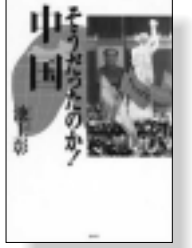
『そうだったのか!中国』 池上彰著