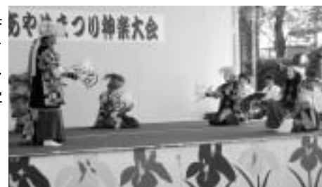
▲観客の目をくぎ付けにした神楽 …第22回一迫あやめ祭り神楽大会 ／7月8日(日) ◀勇壮な動きを見せる鹿踊り …第24回みちのく鹿踊り大会 ／6月24日(日)