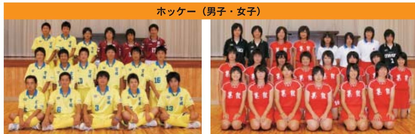
ホッケー (男子・女子)

▲築館高校男子・女子ホッケー部…7月29日(日)～8月2日(木)／佐賀県伊万里市・国見台陸上競技場ほか