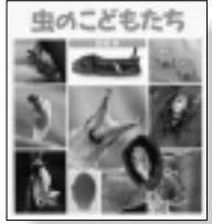
『虫のこどもたち』 新開孝作