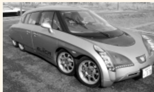
スーパー・エコ・カーのエリーカ