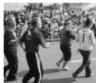
▲昨年10月に金成庁舎で行われたスペシャルオリンピックストーチラン

調査は、手帳をお持ちの方々を対象に無作為抽出し、身体障害者998人、知的障害者394人、精神障害者160人の計1,552人にお願しました。回収率は、全体の56・12%、871人から回答をいただきました。計画策定にあたって、障害者計画の策定協議会を設置し、身体・知的・精神のそれぞれの分野の第一線で活躍している19人を委員として委嘱し、ご検討をいただきました。また、サービスマン提供事業者などの関係団体から貴重なご意見をいただきました。皆さんのご意向をくみ取りながら策定作業を進めました。