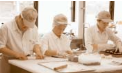
▲「通所授産施設いそっぷ」でのパン作り

障害などの予防と早期発見・療育、治療、医学的リハビリテーションの充実、健やかな暮らしを支えます。障害の原因の一つとなる疾病などの予防・早期発見・早期療育・早期治療を図るとともに障害者の心身の健康の維持・増進・回復を図るために、関係機関との連携を密にしながら、市民一人一人のライフステージ