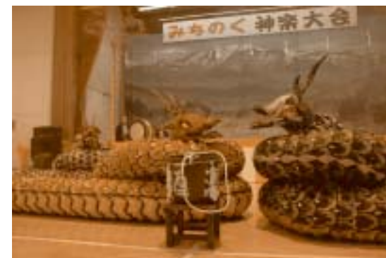
▲特別出演の築館神楽保存研究会による「八岐大蛇」が大トリを飾りました

30年以上の伝統を誇る神楽大会が今年も行われ、栗原市や登米市、そして岩手県一関市から参加した各団体が演舞の技術を競い合いました。会場には多くの神楽ファンが訪れ、各団体の熱演に見入っていました。演舞の審査は3人の審査員によって行われ、鶯沢神楽保存会が団体優勝に輝きました。