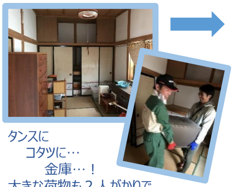
タンスに コタツに… 金庫…！ 大きな荷物も2人がかりで 運び出し。

先月の「はなやま暮らし」でご紹介した「空き家利活用プロジェクト」。その活動として、四月二十一日と二十三日に「空き家片付け隊」を実施しました！当日は十名の方にご参加いただき、家の中の家財や不用品を仕分け・処分。今後移住希望の方などにご紹介できる状態に整備しました。六月にももう一軒、空き家の片付けを行う予定です。