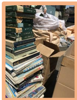
不要物は仕分けして クリーンセンターへ！