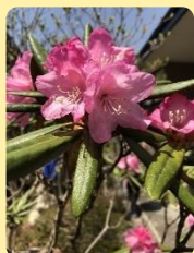
アズマシャクナゲ

なんてたって花山ですから。街に咲いていたステキな「花」たちを紹介したいと思います♪