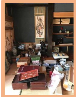
再利用できそうな ものはバザーを開いて 出品します。