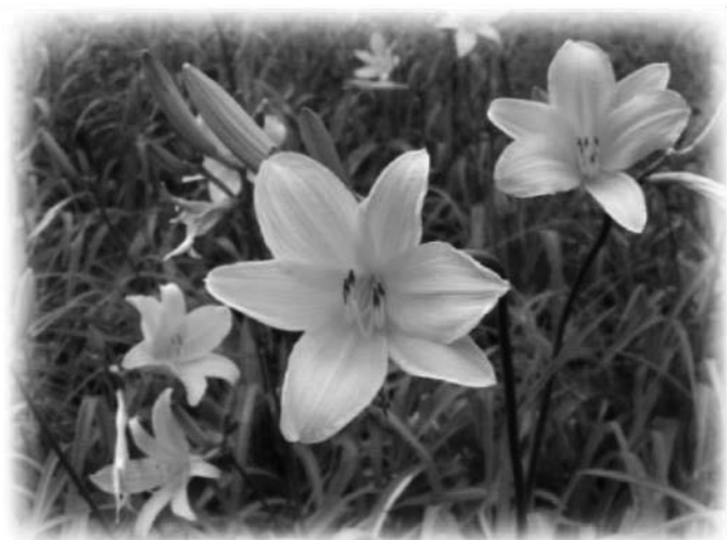
市の花 ニッコウキスゲ