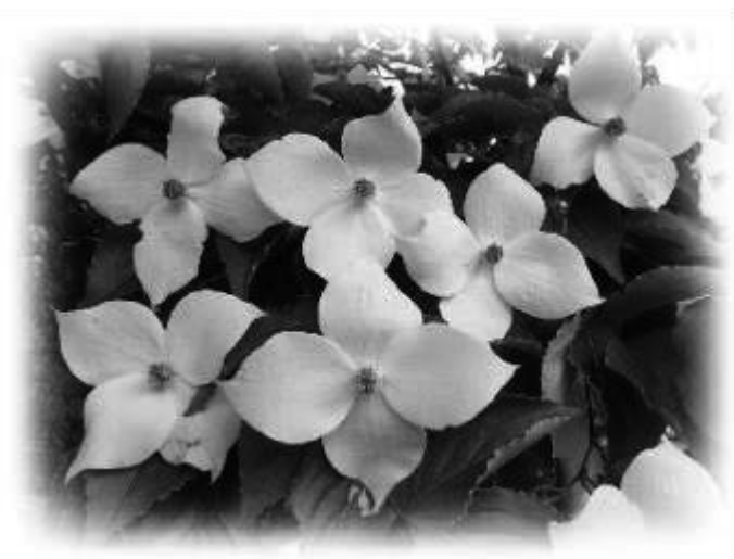
市の木 ヤマボウシ