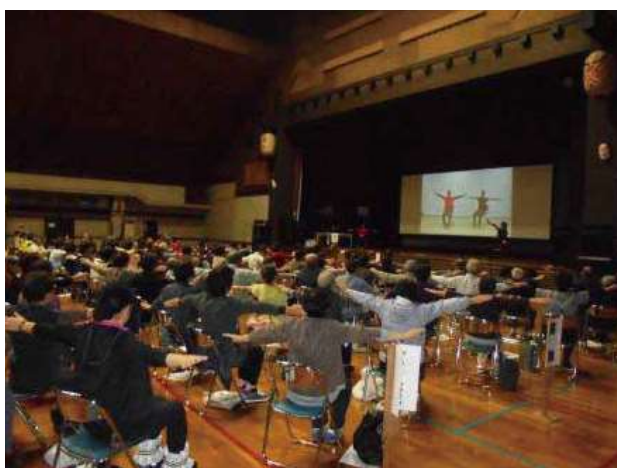
くりはら元気アップ体操交流会の様子

要支援認定者等に対し、身体機能の維持・向上、介護予防及び自立支援に資することを目的に、地域包括支援センター等が作成したケアプランに基づき、指定した事業所などにおいて訪問型サービスや通所型サービスの提供を行います。また、地域の身近な場所で高齢者自らが主体となり、介護予防の取組みを継続して実践できるよう「くりはら元気アップ体操」の普及推進を図ります。