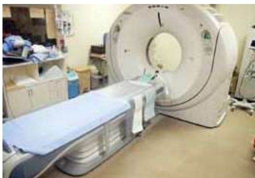
更新予定のCTスキャナ(栗原中央病院)

合併処理浄化槽事業(市設置型・個人設置型) 1億5,672万円 (合併処理浄化槽事業特別会計) (担当：施設課給排水係・施設整備係)