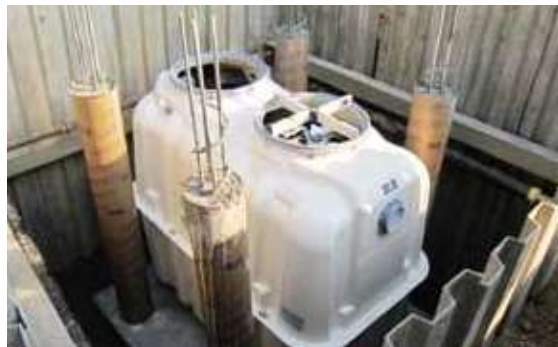
合併処理浄化槽設置工事の様子

公共下水道事業の計画区域内で、下水道が当分の間整備されない区域について、個人が設置する浄化槽に対して、設置費用の一部を助成します。