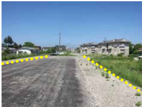
現在整備中の都市計画道路一迫南線

財源 国・県の負担額 1億1,640万円 市の負担額 1億6,693万円 (うち市債[借入金] 1億980万円)