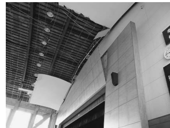
天井、ステージ上部が剥落した志波姫小学校体育館