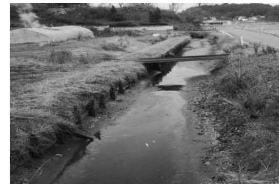
用排水路などの補修を行います