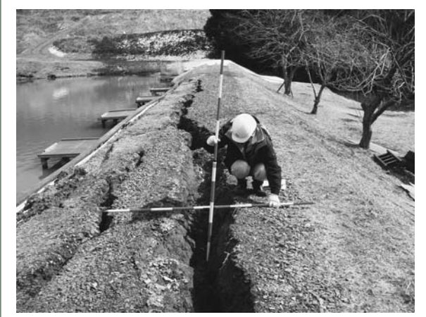
堤体に亀裂の入った大久保沢ため池（若柳）