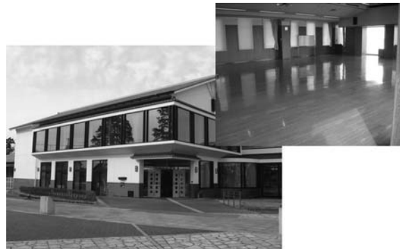
栗原市立図書館と改修予定の大研修室

図書館2階の大研修室を改修し、開架書庫の増設や空調設備改修工事など、図書館機能を充実します。