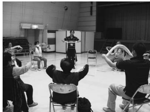
運動機能向上教室の様子

介護予防事業 (介護保険特別会計) 1,692万円 (担当:介護福祉課認定調査係)