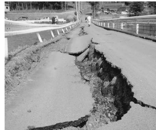
亀裂や段差などの被害を受けた市道陽岩寺線（瀬峰）