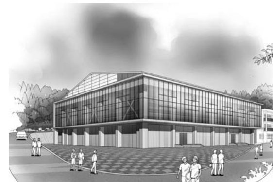
築館中学校体育館完成イメージ図