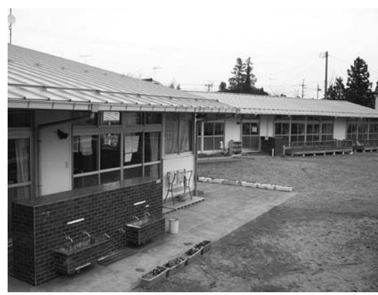
改修予定の若柳川北保育所