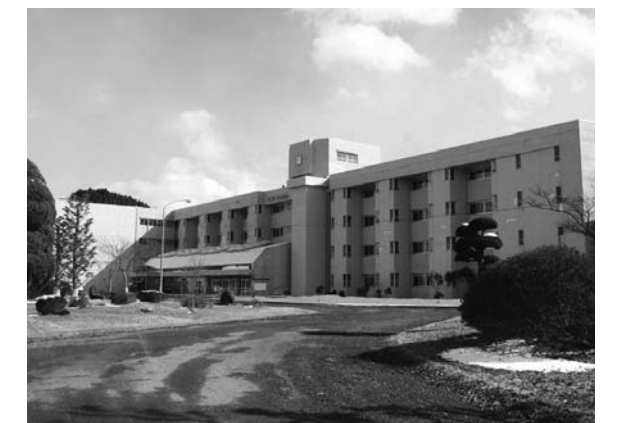
改修予定の栗駒中学校