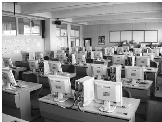
エアコンが設置される特別教室