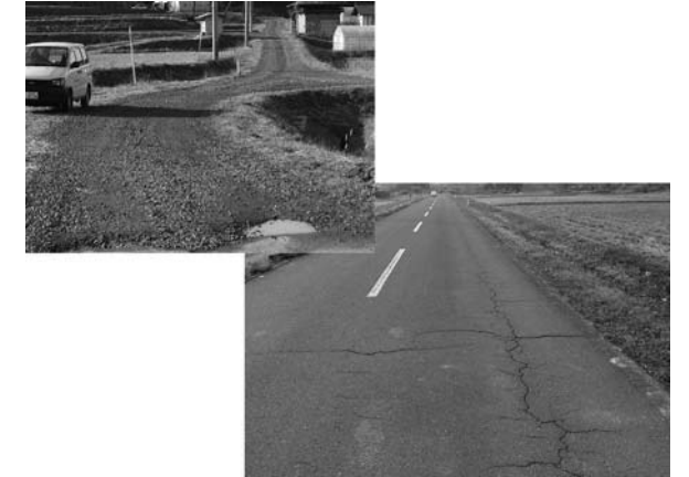
市道や農道の補修などを行います