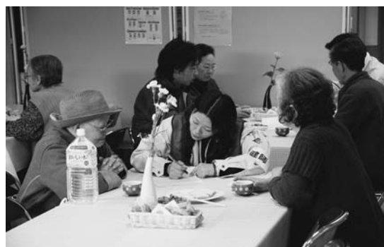
避難者受け入れの様子

避難所経費等 5億2,421万円 火葬経費・人件費等 2億6,947万円 仮設トイレ・発電機等 5,716万円