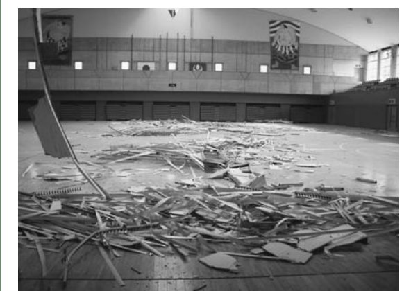
天井の部材が剥落した栗駒総合体育館