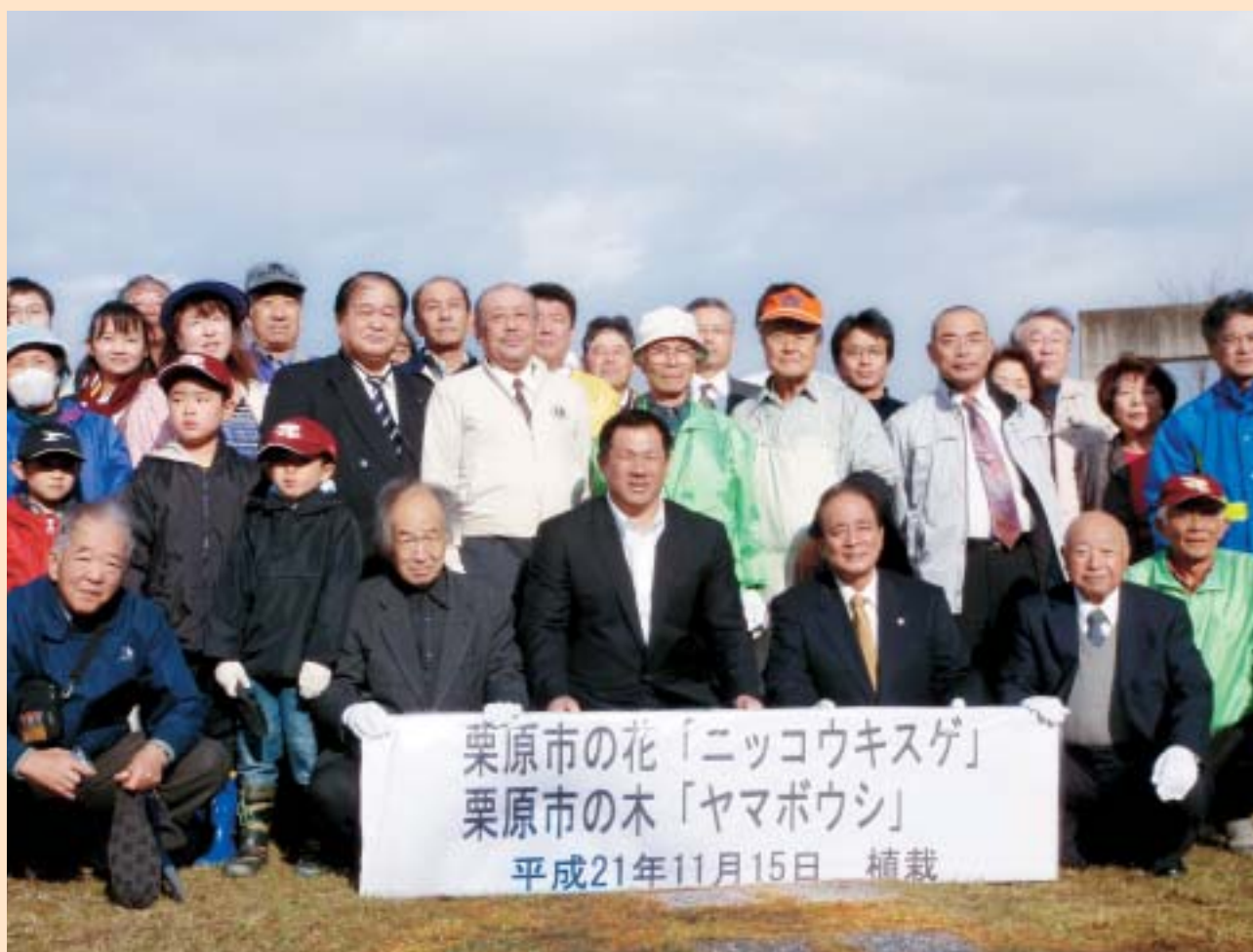
(「市花・市木の記念植樹祭」から)