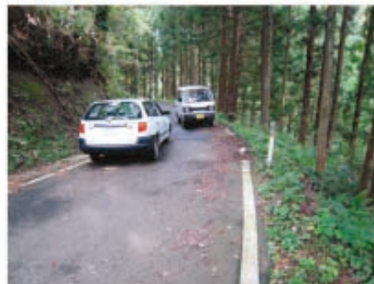
市道芦ノ口上原線