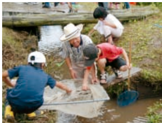
生き物調査の様子