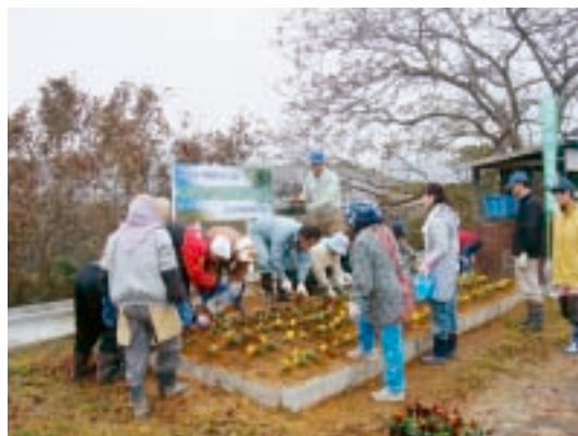
花壇の植替えの様子

田や畑及び農業用水などの資源や農村環境の良好な保全とその質の向上を図るため、地域ぐるみで参加する共同活動や環境にやさしい農業に向けた営農活動に対して支援を行います。