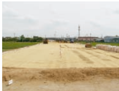
川北川南線道路整備の様子

財源 国・県の負担額 2,520万円 市の負担額 1億5,408万円 (うち市債【借入金】 1億3,790万円)