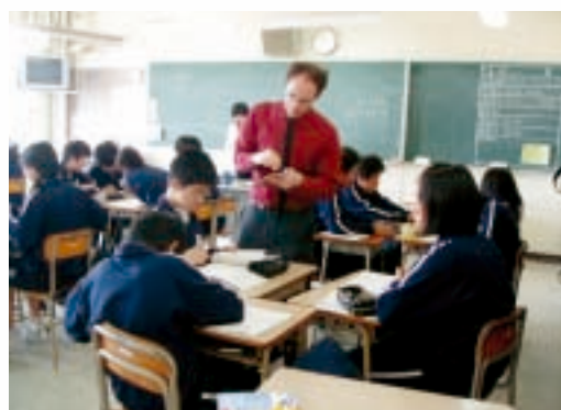
外国語指導助手による授業の様子

外国語指導助手(ALT)を市内全中学校に1人ずつ配置(合計10人)し、中学校等で英語教育の推進や地域交流等を推進します。