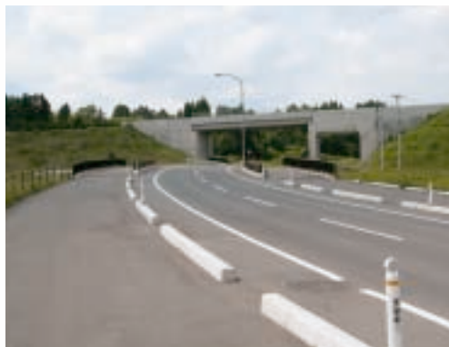
都市計画街路源光町田線

財源 国・県の負担額 4,260万円 市の負担額 7,152万円 (うち市債【借入金】 4,310万円)