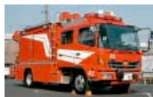
救助工作車(イメージ)

自然災害等の様々な災害に備え救助工作車を更新します。高度救助資機材・テロ対策用特殊救助資機材などを搭載し、機動性を持ち、あらゆる災害に対応します。