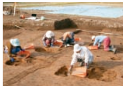
伊治城跡発掘調査の様子

財源 国・県の負担額 3,830万円 市の負担額 1,993万円 (うち市債[借入金]) 1,140万円)