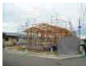
建設中の市営下山住宅(瀬峰)