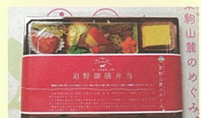
「追野御膳」弁当(会席料理丸勝) 栗駒山麓のめぐみ認定品

【その他】 2週間以内に海外渡航歴のある方や発熱の症状、感染者と濃厚接触のある方は参加をご遠慮ください。その他、感染防止にご協力願います。