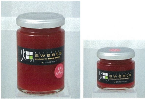
NO.8 店舗名: 欧風菓子&石窯パン工房パレット (有限会社パレット) 商品名: 生ジャム 苺