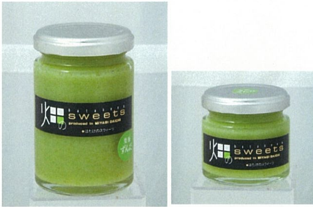
NO.6 店舗名:欧風菓子&石窯パン工房パレット (有限会社パレット) 商品名:生ジャム ずんだ

一迫で栽培されたこだわりの枝豆を使ったジャム 素材本来のおいしさをぎゅっと詰めました