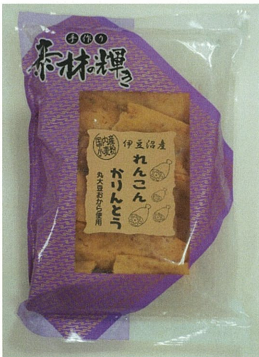
NO.10 店舗名: みえこの部屋 商品名: れんこんかりんとう

栗原の気候が育んだ金成産のりんごの深い味わい 素材本来のおいしさをぎゅっと詰めました