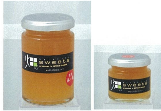
NO.9 店舗名: 欧風菓子&石窯パン工房パレット (有限会社パレット) 商品名: 生ジャム りんご

栗原の気候が育んだ金成産のりんごの深い味わい 素材本来のおいしさをぎゅっと詰めました