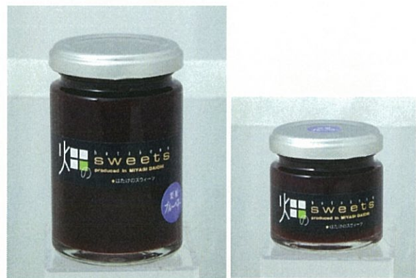
NO.7 店舗名:欧風菓子&石窯パン工房パレット (有限会社パレット) 商品名:生ジャム ブルーベリー

一迫で栽培されたこだわりの枝豆を使ったジャム 素材本来のおいしさをぎゅっと詰めました