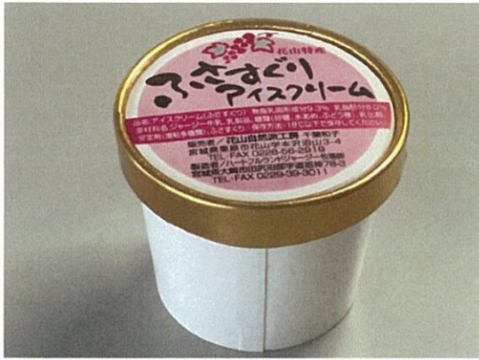
NO.4 店舗名:花山自然派工房 商品名:ふさすぐりアイスクリーム