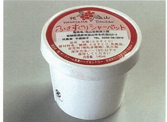
NO.5 店舗名:花山自然派工房 商品名:ふさすぐりシャーベット