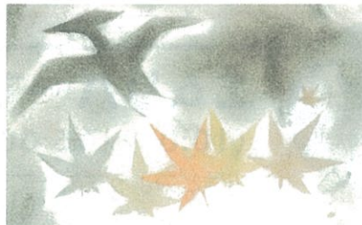
ドパスで描いた作品例