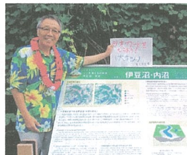
ジオガイドによる撮影例