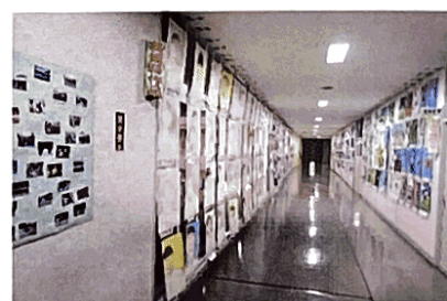
— 西中祭展示 —