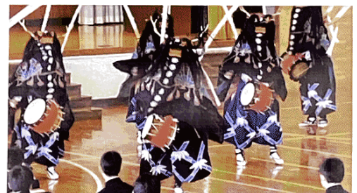
- ハツ鹿踊り -