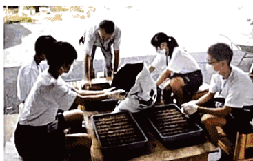
－ 職場体験 －