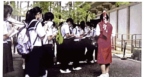
- 岩手研修 -