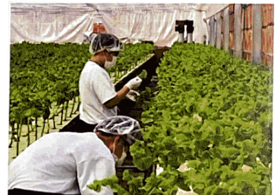
- 職場体験 -