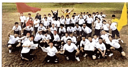
－ 運 動 会 －