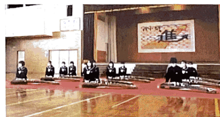
－ 西 中 祭 －