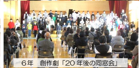
6年 創作劇「20年後の同窓会」