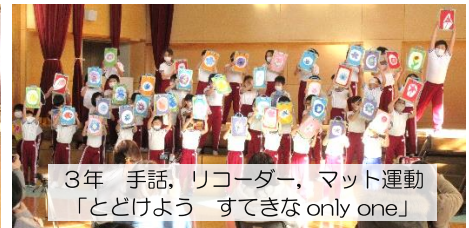
3年 手話、リコーダー、マット運動 「とどけよう すてきな only one」