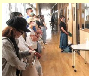
多くの皆様のご参観ありがとうございました。