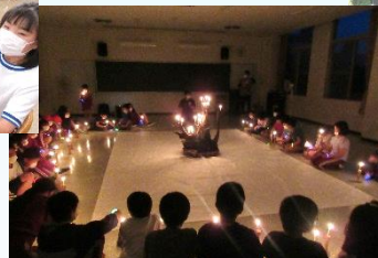
キャンドルサービス