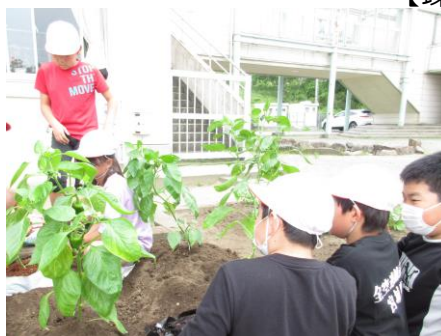
【3年パプリカの苗植え】

どの行事にも、地域の方がたくさん関わってくださり、改めて高清水小学校が地域に支えられていることが分かります。いつもありがとうございます。