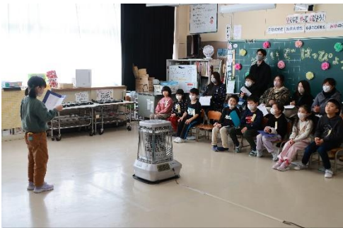
1年 生活 いちねんかんをふりかえろう