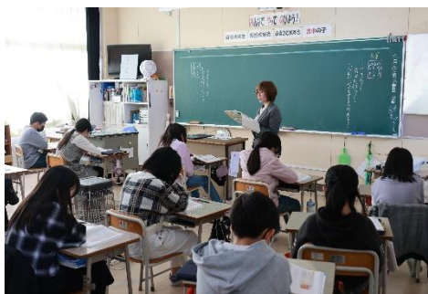
5年 道徳 権利と義務について考える