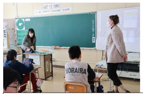
6年 外国語 My Future, My Dream