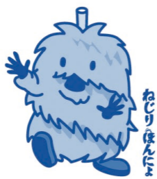
栗原市のマスコットキャラクター

※申込後、大会に不参加が決まった方は、計測タグを同封の返信用封筒にて郵便による返却をお願いいたします。計測タグが返却されない場合、実費を請求させていただきます。