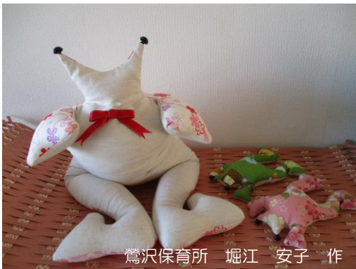
鶯沢保育所 堀江 安子 作