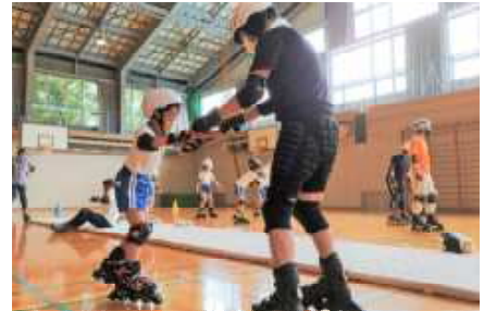
インラインスケート教室

A 人数により検討いたしますが、入学申請が多数になる場合は抽選等を行うこともあります。