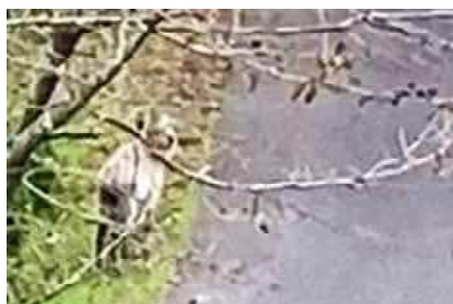
校庭に現れるカモシカ