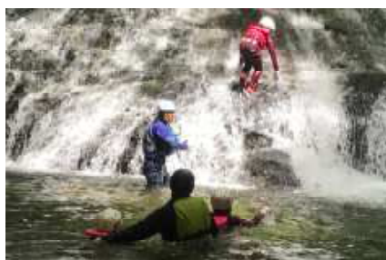
地域の沢で沢遊び