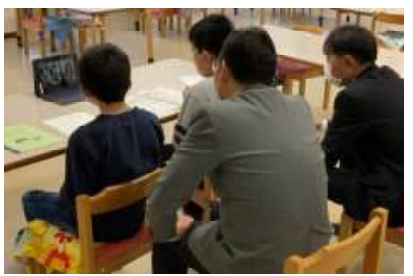
一迫小とビデオ会議