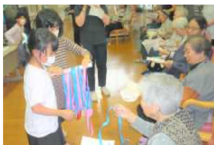
地域のお年寄りと交流