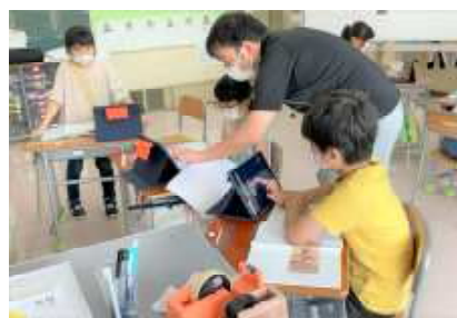
きめ細やかな学習指導