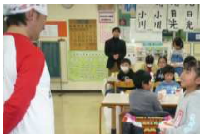
青森リンゴ農家との交流