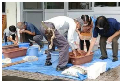
ハタケシメジ栽培