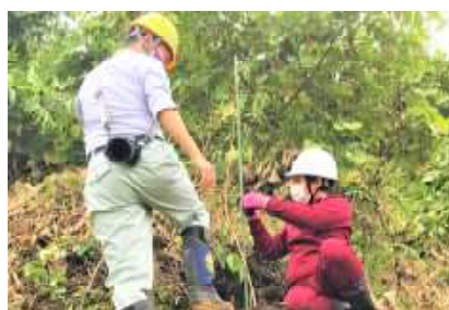
地域の産業を学ぶ(林業)