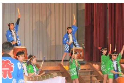
伝統体験・ぶちあわせ太鼓