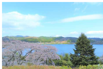
花山小学校から望む花山湖

A 「小規模特認校」制度とは、学校選択制のひとつであり、特定の学校について、居住地に関わらずに就学を認める制度です。栗原市では平成25年度より花山小学校を特認校に指定しています。花山小学校は、豊かな自然環境と地域の教育環境に恵まれ、子供たち一人一人を確実に伸ばす特色ある教育活動を行っています。このような教育を自分の子どもに受けさせたいという保護者の希望、こんな学校で学んでみたいという児童の希望がある場合には、従来の学区を超えて花山小学校に入学・転学することができます。