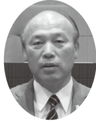
みつおか あずま 三塚 東 議員