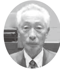
あべ さだみつ 議員 阿部 貞光