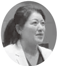
すがわら まき 議員 菅原 麻紀