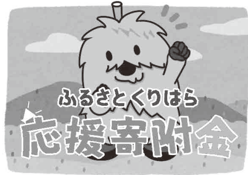
栗原市への寄付のお願い

議員 全国からいただいた寄付の状況はどうだ。 市長 令和4年度は、3676件で、8543万円。 議員 昨年、最も寄付を集めたのは、宮崎県都城市196億円、2位北海道紋別市194億円、3位が北海道根室市176億円。他の自治体も多くの寄付金をいただいている。栗原の返礼品には魅力がないのか。 市長 返礼品の種類が少なく感じている。今年度か