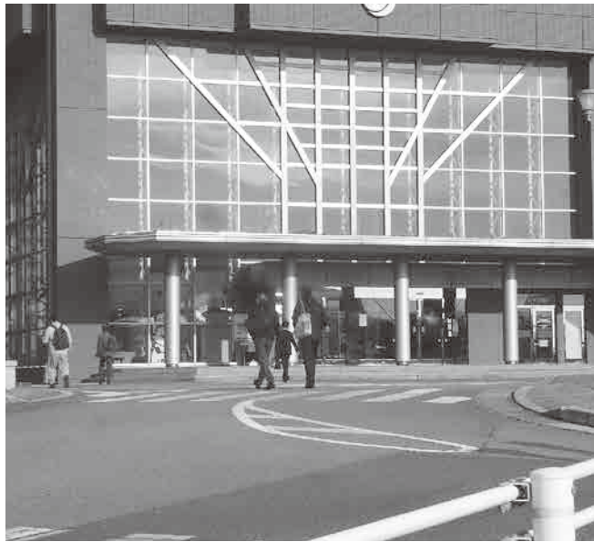
市民の幸せのために全力投球を

議員 令和4年度人事院勧告は、行政職で平均0・96%、3869円、期末手当0・1か月増の4・5か月分の勧告をおこなった。初