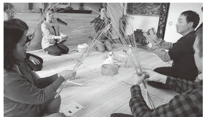
滞在形の観光に向けた事業

議員 私は平成30年10月、台湾南投市との産業交流事業に参加した。事業の目的は、栗原市内の産業経済団体の人々と栗原の生産物を紹介し、物産交流の「きっかけ」づくりと、国内・海外の観光の推進につなげる互いの交流を活性化させることとしている。