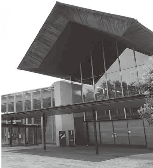
火葬場の広域連携を推進すべき

議員 市内の郷土芸能では次世代への継承に課題が生じている。市の支援が早急に必要であるが、考えを聞く。 教育長 市公式LINEでの情報発信や演舞の記録保存を強化する。現場の意見