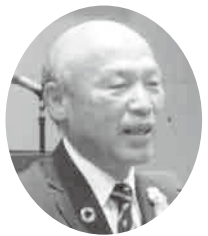
みつまた あきら 議員