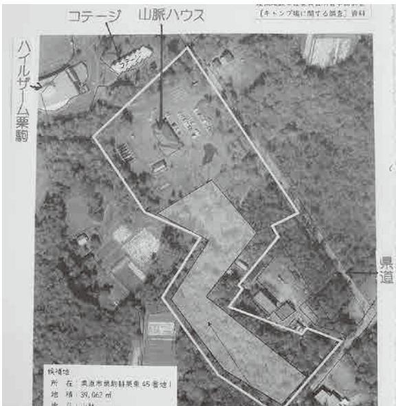
山脈ハウス下のZ模様が予定地

議員 キャンプ場をつくる目的は、市民の社会教育活動の推進のためか、市外から利用者を呼び込んで経済効果を期待するためか。また、市内にある既存のキャンプ場の充実ではなく栗駒