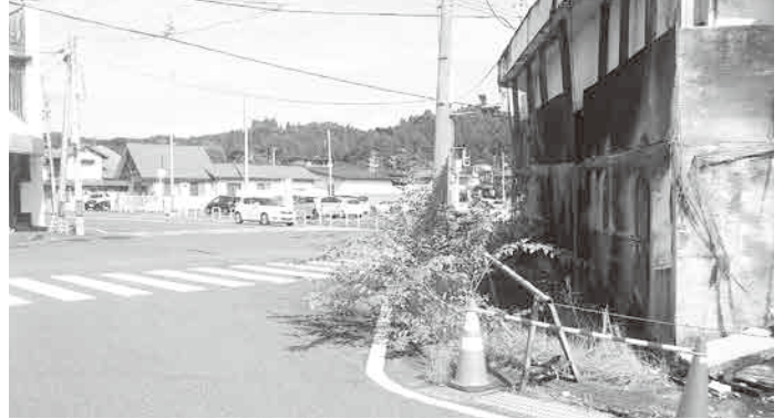
岩ヶ崎中心部の荒廃した建物

議員 岩ヶ崎地区にある建物が荒れ放題になっている。令和4年12月議会で空き家対策の件を質問しているが、多くの市民から一日でも早く対策を取るよう強い要望がある。栗原市では、所有者に令和5年8月15日の期限をつけて強制力のある改善命令を出しているが、所有者が守っていないのはなぜか。 市長 市では度重なる改善命令を出しているが、所有者は、資金がなく改善が出来ない返答である。今後、