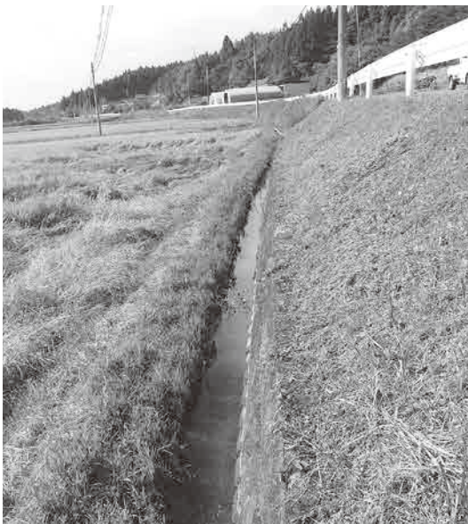
令和7年から整備の有賀沢排水路

議員 高清水、瀬峰を流れる小山田川水系は、台風や線状降水帯に非常に弱い構造となっている。市は、水害防止策をどのように図っていくのか。また、線状降水帯に対する防災の備えや、防災の行動指針などを聞く。 市長 河川の堆積土砂の撤去は、今年度、高清水の甲牧堀地内の透川で実施中である。被害を最小限に抑え、迅速な回復を図るよう、地域防災計画などを実践し、防災マップの普及活用を推進していく。豪雨時は、避難指示を早め早めに出し「空振り」は良い。見逃しは駄目だ。」これを市長と職員の間で合言葉にして意思統一している。 議員 移住定住政策と農業振興策は、表裏一体と捉えているが、栗原の魅力をさらに高めるため、関係人口のうち農業関連人口を増やす施策と、6次産業化に力を入れた政策を期待するが。 市長 くりはら産地見学バスツアーなど主催する。また、6次化育成塾を開催し、受講者の中から、6次産品が創られ、商品が育っていく。