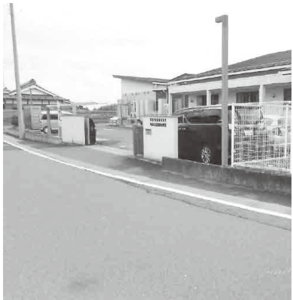
子ども達の安全が第一