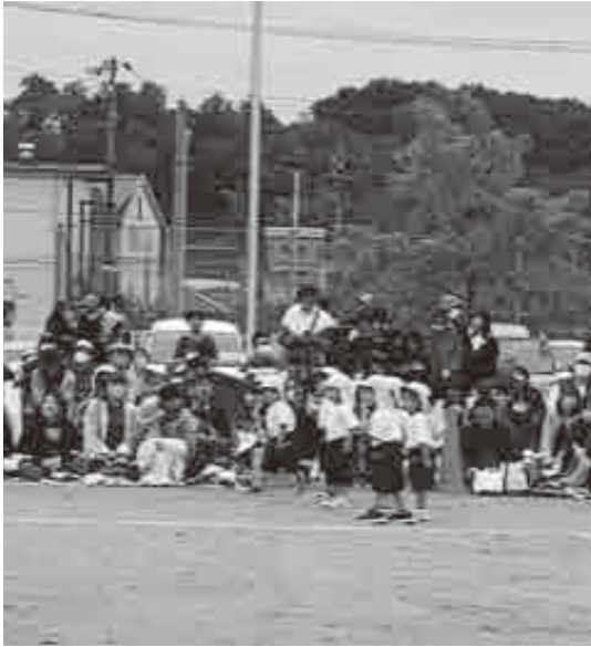
子どもたちと触れ合う時間適切か

教育長 学校支援システムを導入し出席簿・通信票などをデジタル化や押印の廃止、メールを活用した簡易な報告など業務の軽減を図っている。また、部活動は外部指導者の配置やスポーツ少年団などの活動は公務外である事を明確に位置付け、部活動顧問の負担軽減を図っている。さらに、定