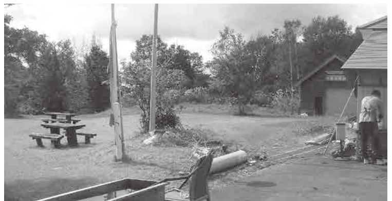
栗駒キャンプ場建設予定土地

議員 令和7年度オープン予定の栗駒キャンプ場は、 市長 今年度予定の基本計画は、専門家や地元愛好者などの意見を踏まえ検討するので遅れる見込みで、キャンプ場はテントが張れるリーススペースやキャンピングカーなどが利用できる施設を考えている。 議員 市内のキャンピングカー愛好者やキャンピングカー所有者との連携が必要と思うが、 市長 市内のキャンピング愛好