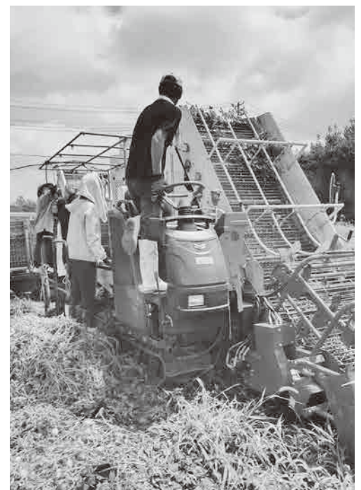
持続可能な農業を考えるとき

議員 遊休農地や荒廃農地をどのように活動しているのは理解するが、稲作以外の畑作で、企業誘致を考えているのか。例えば、学校給食で使う食材を買い上げる前提で作る人を募集しているか。