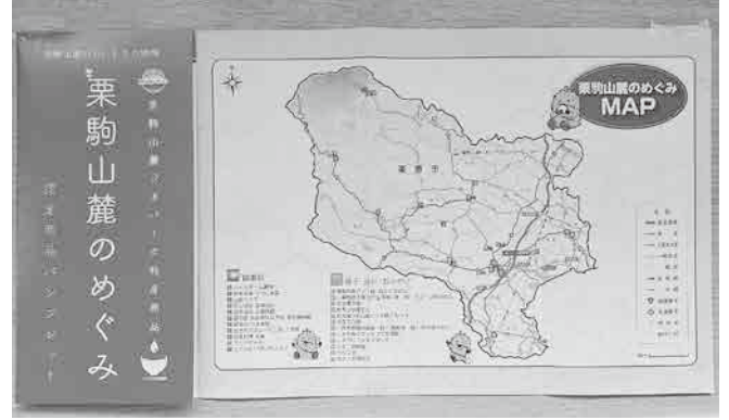
「栗駒山麓のめぐみ」パンフレット

議員 市長は4月の記者会見で、ふるさと財団の補助事業「地域再生マネージャ―事業」に取り組むと発表しました。本事業を遂行する目的と目標は何かを聞く。 市長 外部専門家を招致し、「ふるさと再生事業」として、地域住民が、主体となった地域おこしや、地域資源などを活用したビジネスの創出を目的にしている。特に「栗駒山麓のめぐみ」認定商品を磨き上げ、ふるさと納税の返礼品などを増やして、地域再生に取り組んでいく。