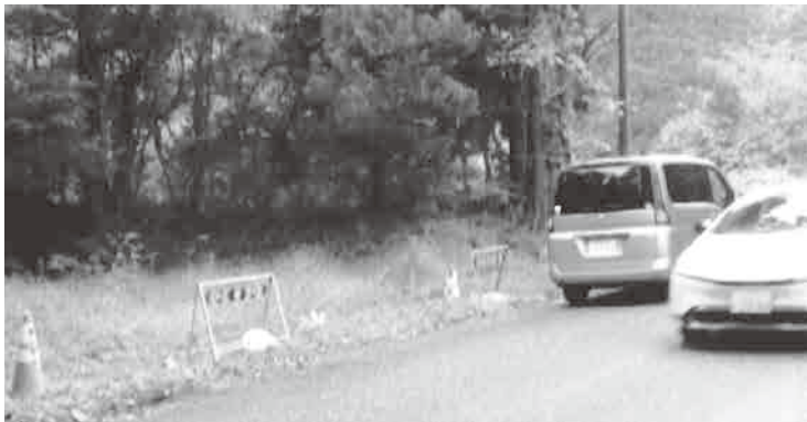
改良が進まない398号浅布地内

議員 国道398号花山地 区の浅布地内の約1000 坪の区間は狭隘で大変危険 な道である。また、ダム周 辺地内は、急カーブで、上 層木が道路を覆い、立木で トンネル状態の場所もあり、 冬の凍結期間が長い。地区 民の通勤、通学路である。 国、県への要望を聞きたい。