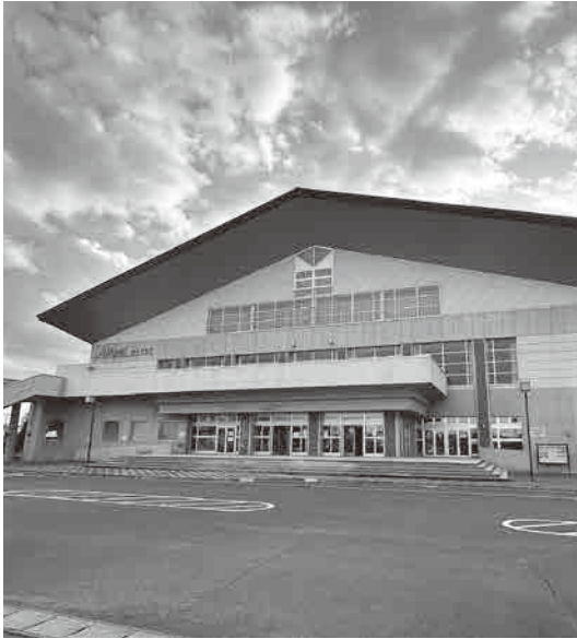
冷房導入が待たれるアスパル若柳

議員 市内の公民館や公共施設、観光地では公衆無線LANが使えない。公民館でパソコン教室を開いてもWiFiが使えず苦労しているとの事だ。また観光客からも栗原市では公衆無線LANが無いので、電波