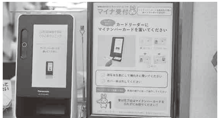
カードリーダーで受け付け

議員 全国的にマイナンバーカードにひも付けされる健康保険証の「マイナンバー保険証」に別人の情報が入り込んで登録されるなどマイナンバーカードに関する問題が噴出している。 政府は来年の秋には現在の紙の保険証を廃止する方針だが、高齢による認知症の方や意思決定ができない重度の障がい者など、マイナンバーカードまたは、資格確認書を申請できない人に対する対応はどうか。