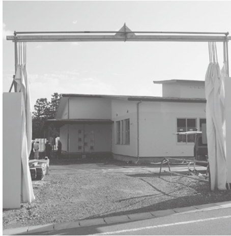
完成が待たれる瀬峰幼保一体施設

9月定例会において、平成29年度一般会計の予算に12億1580万9000円を追加し、総額475億4860万3000円にする補正予算を可決しました。また、国民健康保険特別会計を4つの特別会計で、追加や歳入の組み替え、過年度事業費精算に伴う経費などを計上する予算を可決しました。