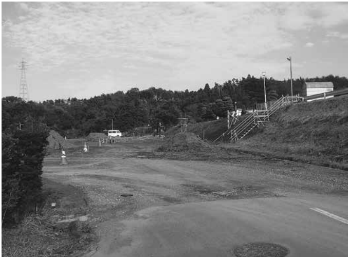
売却した金成工業団地分譲地