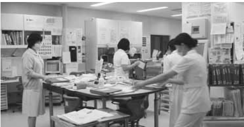
中央病院のナースステーション

貸付対象者は、看護師などを養成する学校または養成所に在学し、卒業後、すぐに栗原市立病院などで看護師の業務に従事する意思を有し、学業成績が優秀で、心身ともに健康である方です。 ○貸付金額は、月額5万円で貸付期間は、4年間で限度としています。 ○養成施設を卒業後、すぐに市立病院などにおいて、正規職員として看護師の業務に従事し、貸付期間に1年を加えた期間に従事した場合は、返還が免除されます。