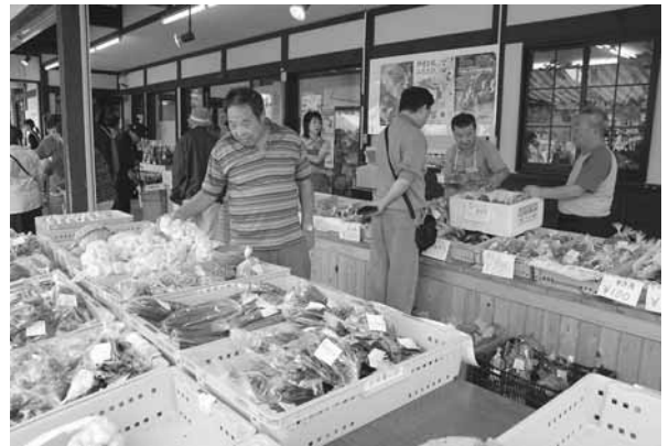
地場産品が並ぶ「自然薯の館」