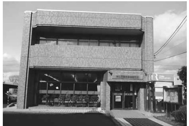
ライフローンの窓口「労働金庫築館支店」