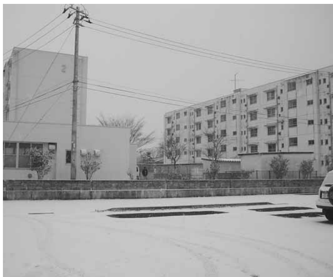
市営住宅となる金成宿舎