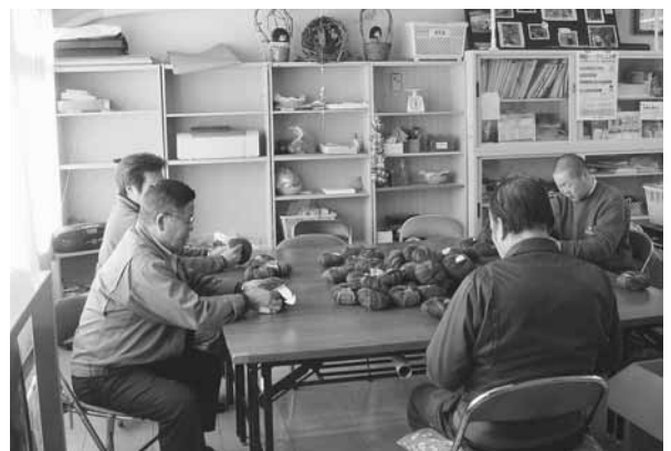
作業にはげむ利用者（虹色共同作業所）