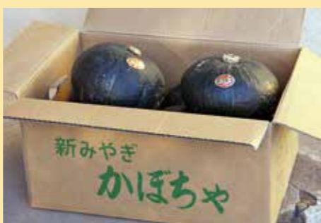
▲大切に育てられたかぼちゃ