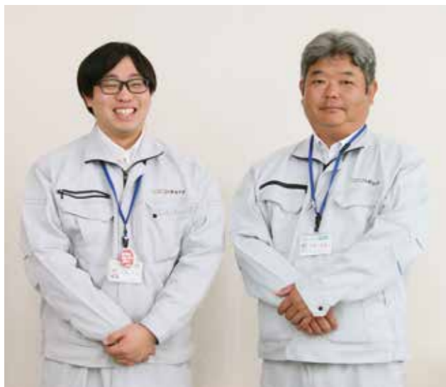
新みやぎ農業協同組合 志波姫宮農センター