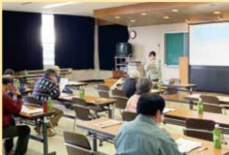
▲栽培知識を深めるため講習会に臨む生産者