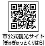
市公式観光サイト 「ぎゅぎゅっとくりはら」

栗原の魅力がより身近に感じられるようになった、栗原市公式観光サイト「ぎゅぎゅっとくりはら」の新機能を紹介します。