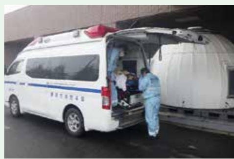
▲救急車受入件数が増加している栗原中央病院