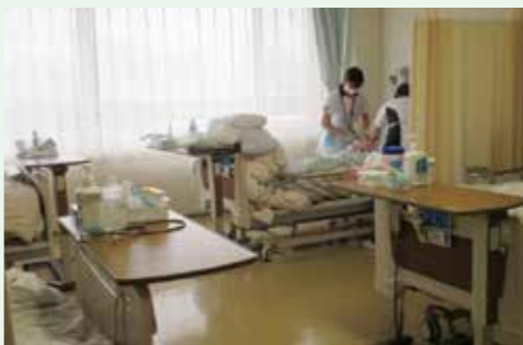
▲病床再編で病床利用率が改善された栗駒病院

どの検討が望まれる。 □ 今後の目標値の達成に向けて、引き続き、将来を見通した医師などの確保策を講じられるよう要望する。