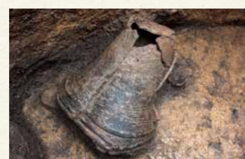
▲縄文時代中期のものと思われる土器

市内の文化財散策 高田山遺跡は、築館地区にある縄文時代、奈良・平安時代の遺跡です。東西にのびる標高47メートルほどの平坦面の少ない丘陵上にあり、北側は緩やかな斜面で、南側は急斜面になっています。 都市計画道路駅前大通線整備事業の工事計画範囲に高田山遺跡が近接していたため、平成31年度から令和3年度にかけて遺構の有無を確認するための調査を行いました。その結果、縄文時代のものと思われる遺構・遺物が確認されたため、令和4年度から2カ年計画で本格的な発掘調査を行うことになり、6月に開始しました。 令和4年度は、約1950平方メートルを調査し、縄文時代の竪穴建物跡1棟、貯蔵穴※18基、落とし穴1基を確認しました。貯蔵穴18基のうち16基は調査区の南側に集中していて、それ以外の貯蔵穴、竪穴建物跡、落とし穴は北側にありました。 これらの遺構のうち、竪穴建物跡と貯蔵穴からは縄文時