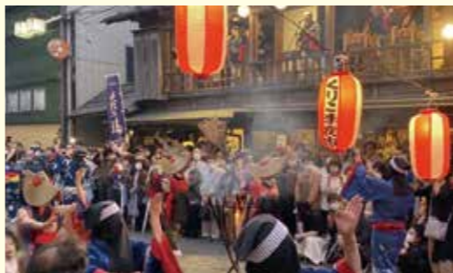
▲盛り上がりを見せるくりこま夜市

また、久しぶりに帰省した人々と、ふるさとでの懐かしい再会が果たされることを祈っています。