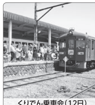
くりでん乗車会(12日)