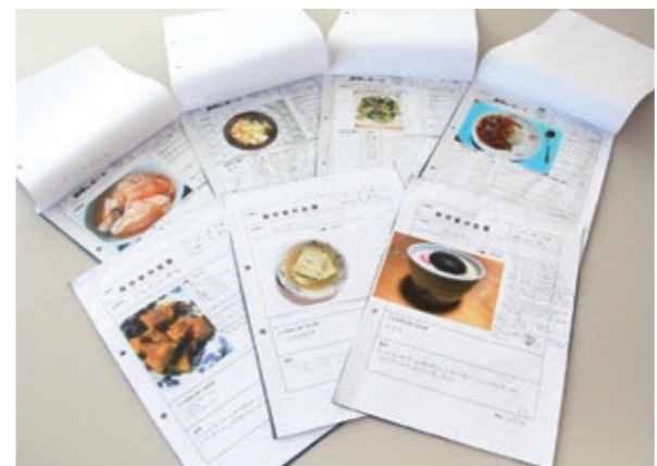
▲若柳中学校の生徒たちによる調理レポート

ているものが10年後の自分の体を作る」と、日ごろから教えています。食は、自分の体を丈夫にするだけでなく、心も育てます。生徒たちが親になったときに、1から10まで毎日完璧に作れとは言いません。手抜きをしても良いのです。週に1回だけでも、手間暇かけたものを作って食べてもらいたいと思います。 さらに、こそぞというときには、郷土の「までな料理を栗原の新鮮でおいしい野菜で作ってみてください。その料理は、この先の子どもの記憶に残り、作り続けられることで、我が家の味になるのではないかと、思います。