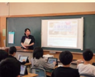
▲小学校でのジオパーク学習

タル版の作成や、同センターの企画展示などに活用させていただいております。今後も、子どもたちの世代に「豊かな美しいくちはら」をつなぐため、活動の柱である「保全・教育・持続可能な開発」に関連したさまざまな活動を行ってまいります。皆さまも栗原の美しい自然や歴史、文化に触れながらご家族で改めて自然災害との共生を考えるきっかけにいただければと思います。