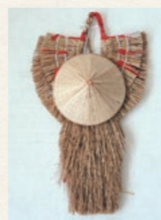
▲壁飾り用のみのと笠