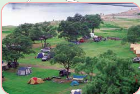
② 「花山青少年旅行村」の湖畔を臨むキャンプ場