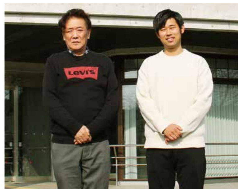
一般社団法人はなやまネットワーク

県内最大の面積を誇る栗原市は、地区によって全く異なる特徴を有しています。今回紹介した花山地区も、豊かな自然が生み出した名所や特産物、仙台藩の関所があった歴史、ダム建設によって現在の町並みができた経緯など、さまざまな特徴があります。花山湖沿いをドライブし、おいしい特産品でお腹を満たした後は、豊かな自然を感じる名所を巡る。花山を満喫して、心も体もリフレッシュしませんか。