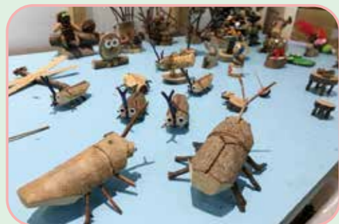
④ 「こもれびの森 森林科学館」でのクラフト教室の作品