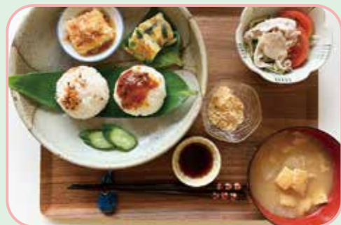
③ 「湖畔のみせ 旬彩」の地元食材を生かした日替わりおにぎりランチ