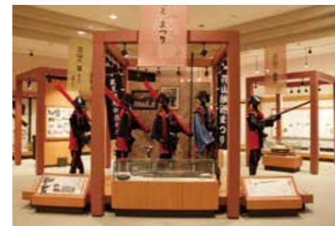
▲花山鉄砲まつりの展示