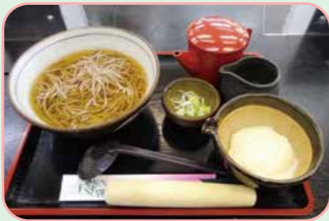
① 花山名物を楽しむ「道の駅路田里 はなやま」の自然薯そば