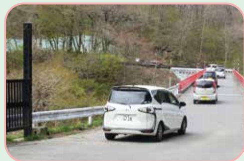
⑤ 秋田県へ続く国道398号