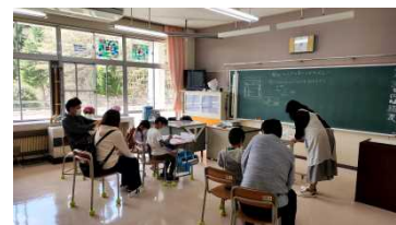
2・3年図工 絵の具を使って

5・6年生は道徳を学習しました。自分のことは自分で行うことの大切さを学習しました。自分の考えをしっかりと持ち、堂々と発表する姿はさすが花山小の高学年です。毎日楽しく元気に、複式指導の良さを生かし、主体的・対話的な学習で考えを深めながら、子供たちに学ばせていきたいと考えます。