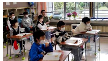
5・6年道徳 お母さんお願いね