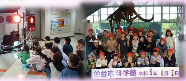
仙台市科学館 令和5年6月2日