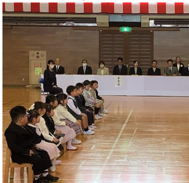
【入学式】 15名の元気な新1年生を迎えました。