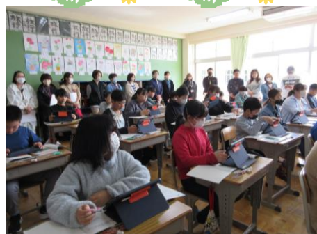
【学習参観日】 新しい学年になり、真剣に頑張っている姿を保護者の皆様に見ていただきました。